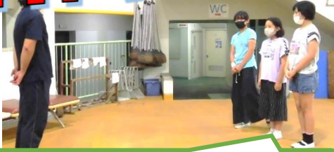
入所式！！ 代表の3人で宣誓。しっかり言えました。