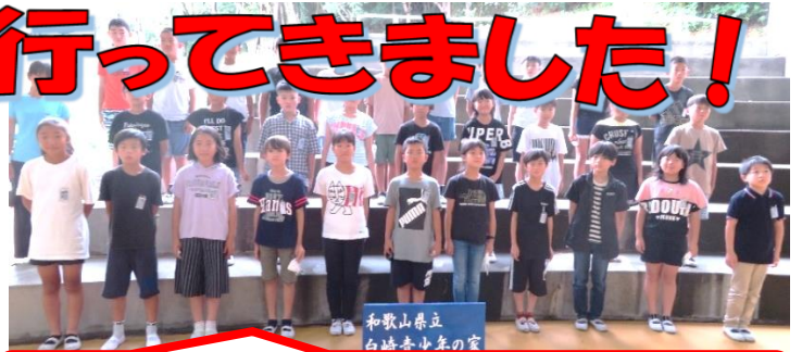
ディスタンスを保ちながら集合写真！ハイチーズ。