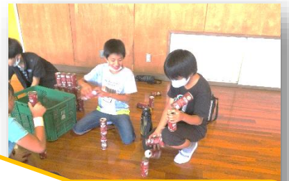
「空き缶積み」に無我夢中。こんな真剣な表情は、教室では絶対にお目にかかれない…そんなことないわ、なっ？！